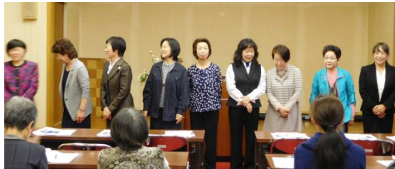
新しい役員に選出された皆さん

総会終了後は、会場を「割烹いわみ」に移動して、懇親会を行いました。懇親会では、これまでの思い出話やこれからの活動予定などの話題で大変盛り上がりました。