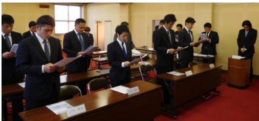
誓いのことばを 朗読中

総会後に行われた懇親会では、島原商工会議所青年部会長、同筆頭副会長や銀行各支店長に来賓としてご出席頂き、今後の青年部活動の話題などで大変盛り上がりました。