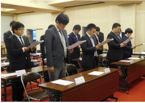
「誓いの言葉」を朗読中